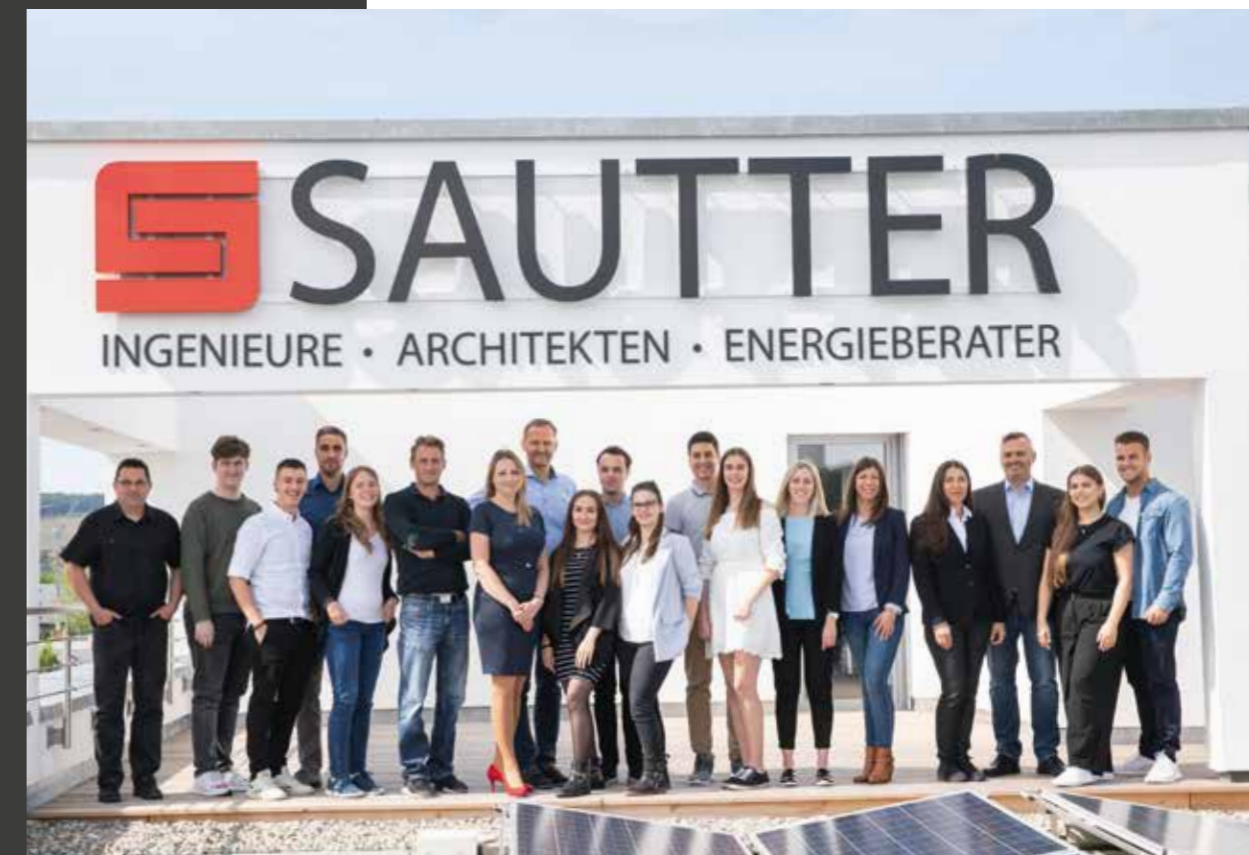
Wir sind für Sie da! Das SAUTTER Team

Von der Einzelbauteilsanierung, wie z. B. einer Dachsanierung bis hin zur kompletten Neugestaltung der von Ihnen betreuten Immobilie, freuen wir uns mit unserem erfahrenen Team aus Architekten, Bauingenieuren und Technikern als starker Partner an Ihrer Seite zu stehen.